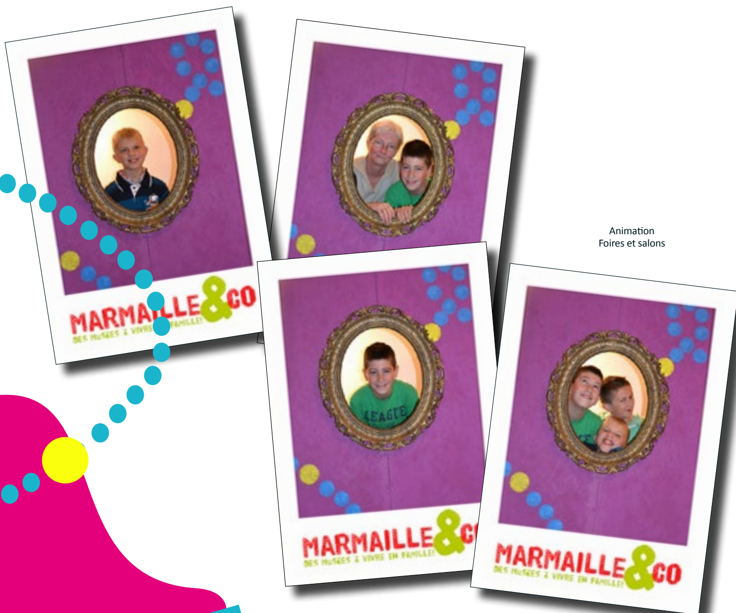
Animation Foires et salons

Une animation spécifique a donc été réalisée afin d'attirer le public sur le stand. Celui-ci et plus particulièrement les enfants sont invités à être pris en photo dans un décor coloré représentant le mur d'un musée. Les parents peuvent se rendre sur le site www.marmaille.be ou sur la page Facebook pour télécharger les photos.